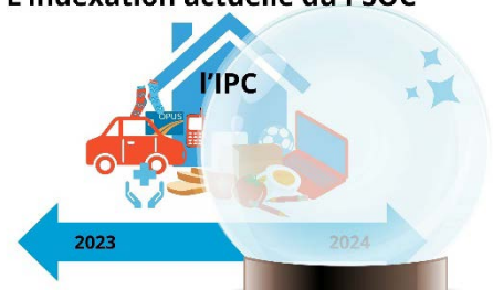
L'indexation actuelle du PSOC

En effet, le MSSS indexe les subventions OCASSS à partir d'une projection établie par le ministère des Finances, combinant Indice des prix à la consommation (IPC) de l'année suivante à celui de l'année écoulée 10 . Cette façon de faire est problématique, car elle ne tient pas compte du portrait des dépenses des OCASSS, puisqu'ils ne sont pas des ménages, en plus de découler de prédictions politiques des économistes du gouvernement. L'indexation des subventions sur ces bases cause l'appauvrissement des groupes, ce qui compromet leur capacité d'action auprès de leurs communautés.