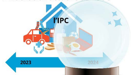
L'indexation actuelle du PSOC

En effet, le MSSS indexe les subventions OCASSS à partir d'une projection établie par le ministère des Finances, combinant Indice des prix à la consommation (IPC) de l'année suivante à celui de l'année écoulée 10 . Cette façon de faire est problématique, car elle ne tient pas compte du portrait des dépenses des OCASSS, puisqu'ils ne sont pas des ménages, en plus de découler de prédictions politiques des économistes du gouvernement. L'indexation des subventions sur ces bases cause l'appauvrissement des groupes, ce qui compromet leur capacité d'action auprès de leurs communautés.