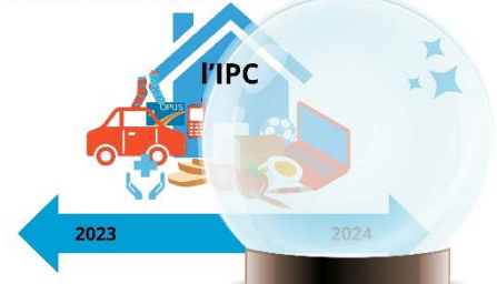
L'indexation actuelle du PSOC

En effet, le MSSS indexe les subventions OCASSS à partir d'une projection établie par le ministère des Finances, combinant Indice des prix à la consommation (IPC) de l'année suivante à celui de l'année écoulée 10 . Cette façon de faire est problématique, car elle ne tient pas compte du portrait des dépenses des OCASSS, puisqu'ils ne sont pas des ménages, en plus de découler de prédictions politiques des économistes du gouvernement. L'indexation des subventions sur ces bases cause l'appauvrissement des groupes, ce qui compromet leur capacité d'action auprès de leurs communautés.