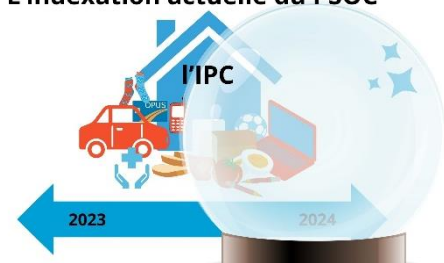
L'indexation actuelle du PSOC

En effet, le MSSS indexe les subventions OCASSS à partir d'une projection établie par le ministère des Finances, combinant Indice des prix à la consommation (IPC) de l'année suivante à celui de l'année écoulée 10 . Cette façon de faire est problématique, car elle ne tient pas compte du portrait des dépenses des OCASSS, puisqu'ils ne sont pas des ménages, en plus de découler de prédictions politiques des économistes du gouvernement. L'indexation des subventions sur ces bases cause l'appauvrissement des groupes, ce qui compromet leur capacité d'action auprès de leurs communautés.